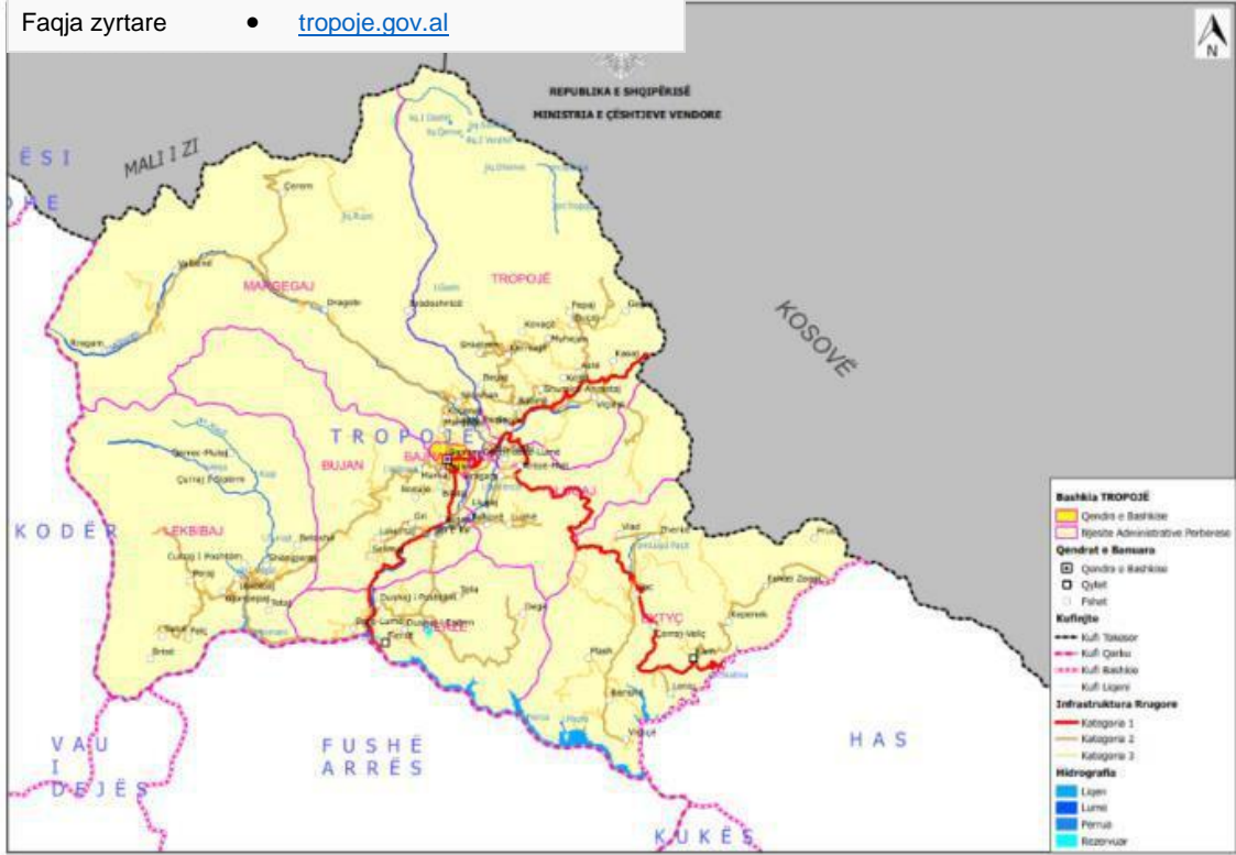
Figura 1: Harta e Bashkisë Tropojë

Tropoja kufizohet në veri me Republikën e Kosovës dhe të Malit të Zi, në perëndim me Bashkinë Shkodër, në jug me Bashkitë Vau i Dejës dhe Fushë-Arrëz dhe në jug-lindje me Bashkinë Has. Qendra e kësaj Bashkie është qyteti i Bajram Currit. Kjo Bashki përbëhet nga 8 njësi administrative. Të gjitha njësitë administrative janë aktualisht pjesë e rrethit të Tropojës dhe qarkut të Kukësit. Bashkia e re ka nën administrimin e saj dy qytete (Bajram Curri dhe Fierza) dhe 68 fshatra.