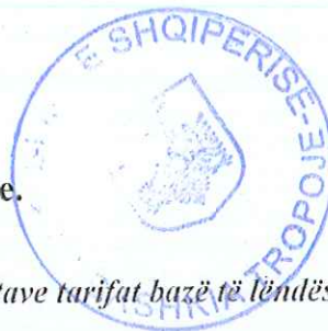
Tabelë 12. Për tarifën në sektorin e pyjeve dhe të kullotave tarifë bazë të lëndës drusore në këmbë