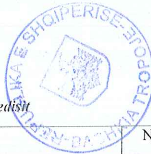
Tabelë 29. Niveli i gjobave në fushën e mjedisit