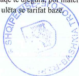
Tabelë 14. Tarifat dysheme për dhënie në përdorim me kontratë qiraje të fondit pyjor dhe kullësor publik për ushtrimin e veprimtarive

Kur lënda e punimit dhe drutë e zjarrit janë nxjerrë nga sipërfaqe të djegura, por materiali drusor është i përdorshëm, tarifat për to do të jenë 40% më të ulëta se tarifat bazë.