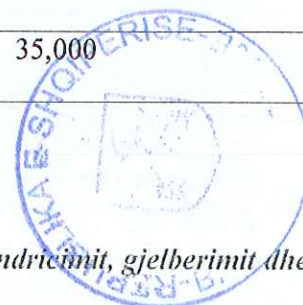
Tabelë 13. Tarifa e shërbimeve (pastrimit dhe largimit të mbetjeve, ndricimit, gjelberimit dhe kanalizime për bizneset)