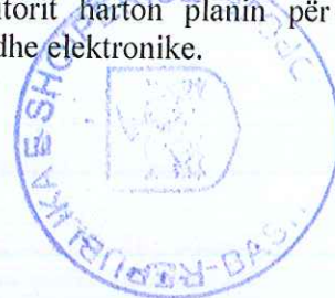
Tabelë 10. Taksa e tabelës

Vendosja e tabelës për qëllim identifikimi është detyrim për të gjithë subjektet, me përjashtim të ambulanteve. Drejtoria e Planifikimit dhe Zhvillimit të Territorit harton planin për vendosjen e mundshme të tabelave për qëllime reklamimi, të thjeshta dhe elektronike.